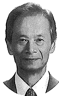
参議院議員 江田 五月